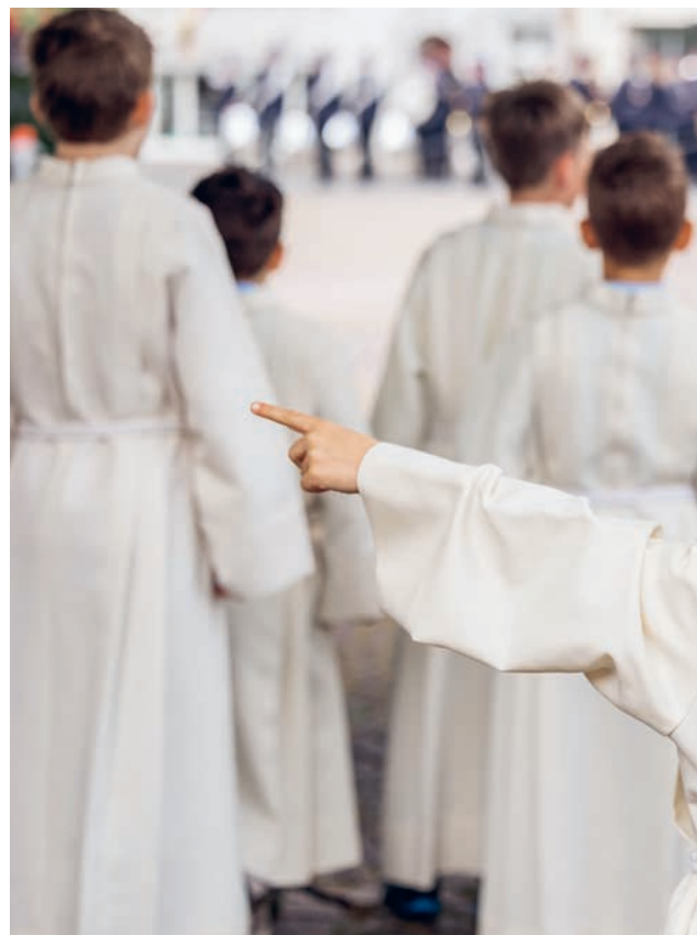
Erstkommunion 2025