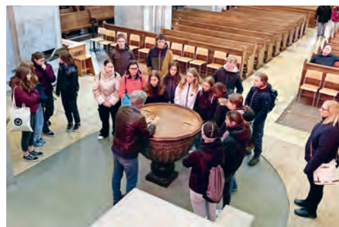
Reformierte Kirche – Besuch im Grossmünster in Zürich