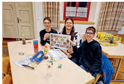
Mondopoly – Drittweltspiel als Bauern in Peru

Statt Religionsunterricht im Schulzimmer besuchen die Oberstufen-Jugendlichen unserer Seelsorgeeinheit im 2. Semester verschiedene Projekte.